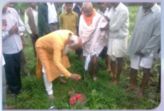
ಹುಬ್ಬಳ್ಳಿಯಲ್ಲಿ ಪಿರಮಿಡ್ ನಿರ್ಮಾಣದ ಶಂಕು ಸ್ತಾಪನಾ ಕಾರ್ಯಕ್ರಮ