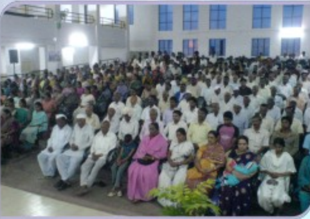
ಬಿಜಾಪುರದಲ್ಲಿ ನಡೆದ ಪತ್ರಿಕೆಯವರ ಧ್ಯಾನ ಕಾರ್ಯಕ್ರಮ