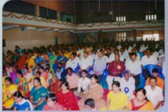
ಸಿರುಗುಪ್ಪದಲ್ಲಿ ಪತ್ರಿಕೆಯವರ ಧ್ಯಾನ ಕಾರ್ಯಕ್ರಮ