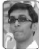
ಅಯ್ಯಪ್ಪ ತಾಂತ್ರಿಕ ಮತ್ತು ವಿನ್ಯಾಸ