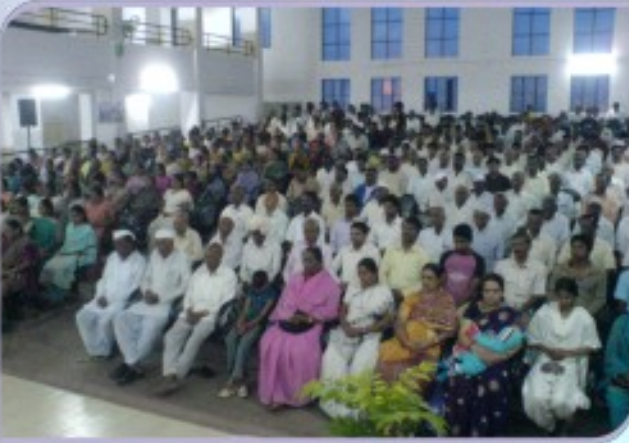
ಬೆಂಗಳೂರಿನಲ್ಲಿ ನಡೆದ ಪತ್ರಿಕೆಯವರ ಧ್ಯಾನ ಕಾರ್ಯಕ್ರಮ