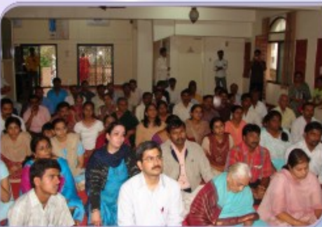
ಬೆಂಗಳೂರಿನಲ್ಲಿ ಪತ್ರಿಕೆಯವರ ಧ್ಯಾನ ಕಾರ್ಯಕ್ರಮ