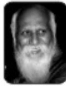
ಬ್ರಹ್ಮರ್ಷಿ ಸುಭಾಷ್ ಪತ್ರಿಕೆ ಸಂಸ್ಥಾಪಕರು :