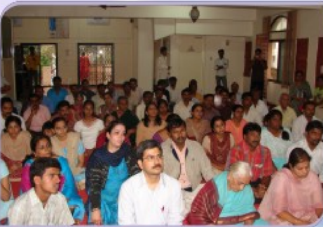
ಬೆಂಗಳೂರಿನಲ್ಲಿ ಪತ್ರಿಕೆಯವರ ಧ್ಯಾನ ಕಾರ್ಯಕ್ರಮ