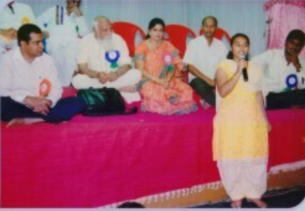
ಸಿರುಗುಪ್ಪದಲ್ಲಿ ಪತ್ರಿಕೆಯವರ ಧ್ಯಾನ ಕಾರ್ಯಕ್ರಮ