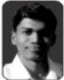
ಪರಿಣತ್ ಶಾಂತ್ರಿಕತೆ ಮತ್ತು ವಿನ್ಯಾಸ