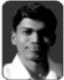
ಪರಿಣಶ್ ಶಾಂತ್ರಿಕತೆ ಮತ್ತು ವಿನ್ಯಾಸ