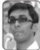
ಅಯ್ಯಪ್ಪ ಶಾಂತ್ರಿಕತೆ ಮತ್ತು ವಿನ್ಯಾಸ