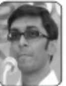
ಅಯ್ಯಪ್ಪ ಶಾಂತ್ರಿಕ ಮತ್ತು ವಿಸ್ತಾರ