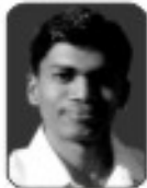
ಪರಿಣಿ ಶಾಂತ್ರಿಕ ಮತ್ತು ವಿನ್ಯಾಸ