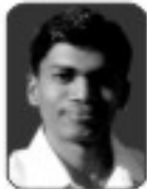
ಪರಿಶ್ ಶಾಂತ್ರಿಕ ಮತ್ತು ವಿಸ್ತಾರ