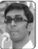
ಅಯ್ಯಪ್ಪ ಶಾಂತ್ರಿಕ ಮತ್ತು ವಿನ್ಯಾಸ