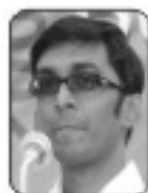
ಆಯುಷ್ಯ ತಾಂತ್ರಿಕ ಮತ್ತು ವಿನ್ಯಾಸ