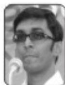
ಆಯುಷ್ಯ ತಾಂತ್ರಿಕ ಮತ್ತು ವಿಸ್ತಾಸ