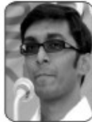
ಅಯ್ಯಪ್ಪ ತಾಂತ್ರಿಕ ಮತ್ತು ವಿನ್ಯಾಸ