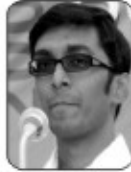
ಅಯ್ಯಪ್ಪ ತಾಂತ್ರಿಕ ಮತ್ತು ವಿನ್ಯಾಸ